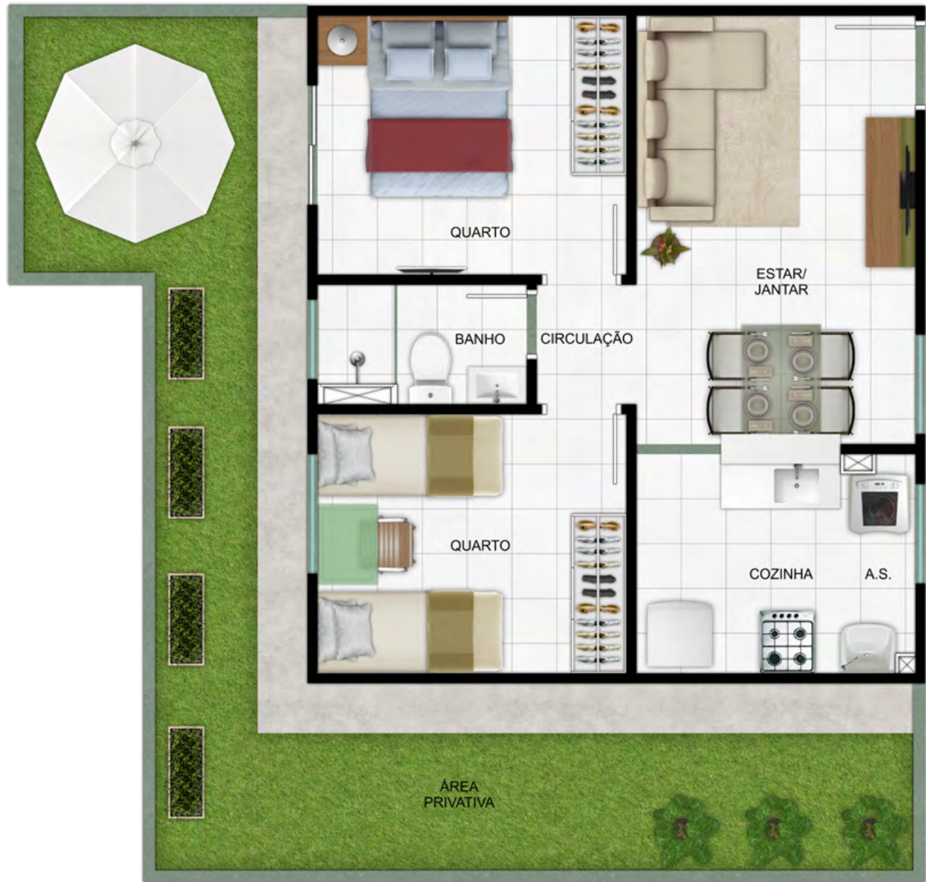
Ref.: Apto. 102 - Bloco 1