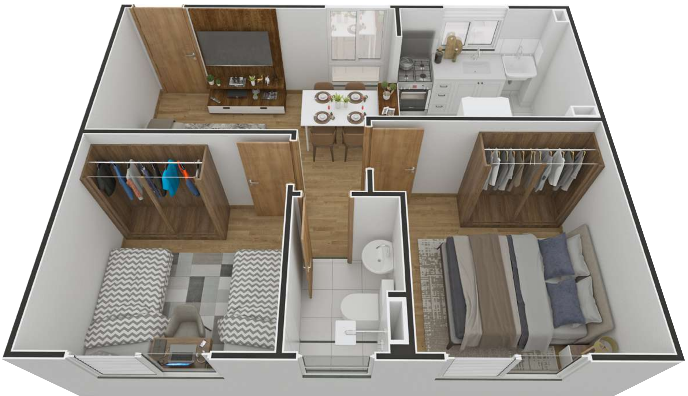
APARTAMENTO 202 | BLOCO 10

Imagem ilustrativa com sugestão de decoração. Os móveis, objetos, revestimentos e demais acabamentos não fazem parte do Contrato. O empreendimento e suas unidades serão entregues conforme Memorial Descritivo. "Importante destacar que as unidades serão entregues no contrapiso. Imagem sujeita a alterações devido ao desenvolvimento do projeto e compatibilizações técnicas. Interfone: será instalado sistema de intercomunicação entre guarita e unidades privativas que funcionará através da rede de telefonia móvel disponível no local. (para este caso a responsabilidade de contratação da operadora de telefonia e do aparelho será do cliente) ou sistema tradicional com cabeamento (nesse caso será entregue um aparelho de interfone por apartamento). Independente do sistema utilizado as tubulações seca e sondada serão entregues (sem fiação). Será deixada uma previsão de ponto de interfone para elevador (ou para previsão de elevador) no primeiro andar ou no térreo, no hall de escada sem acesso a guarita.