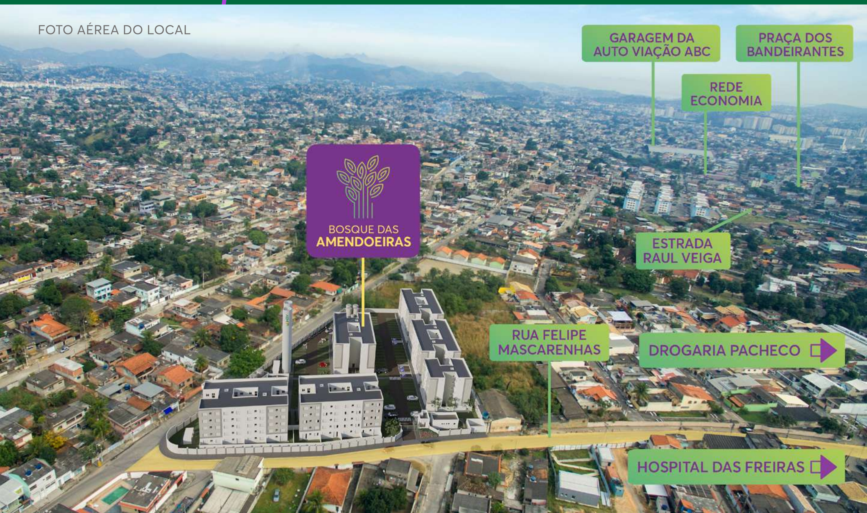
FOTO AÉREA DO LOCAL