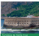
Fortaleza de Santa Cruz