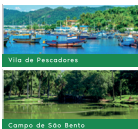
Vila de Pescadores