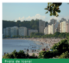
Praia de Icaraí

E, AO MESMO TEMPO, PODER DESFRUTAR DAS TRADICIONAIS ATRAÇÕES DA CIDADE.