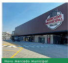
Novo Mercado Municipal

O PRIVILÉGIO DE MORAR NO NOVO CENTRO DE NITERÓI.