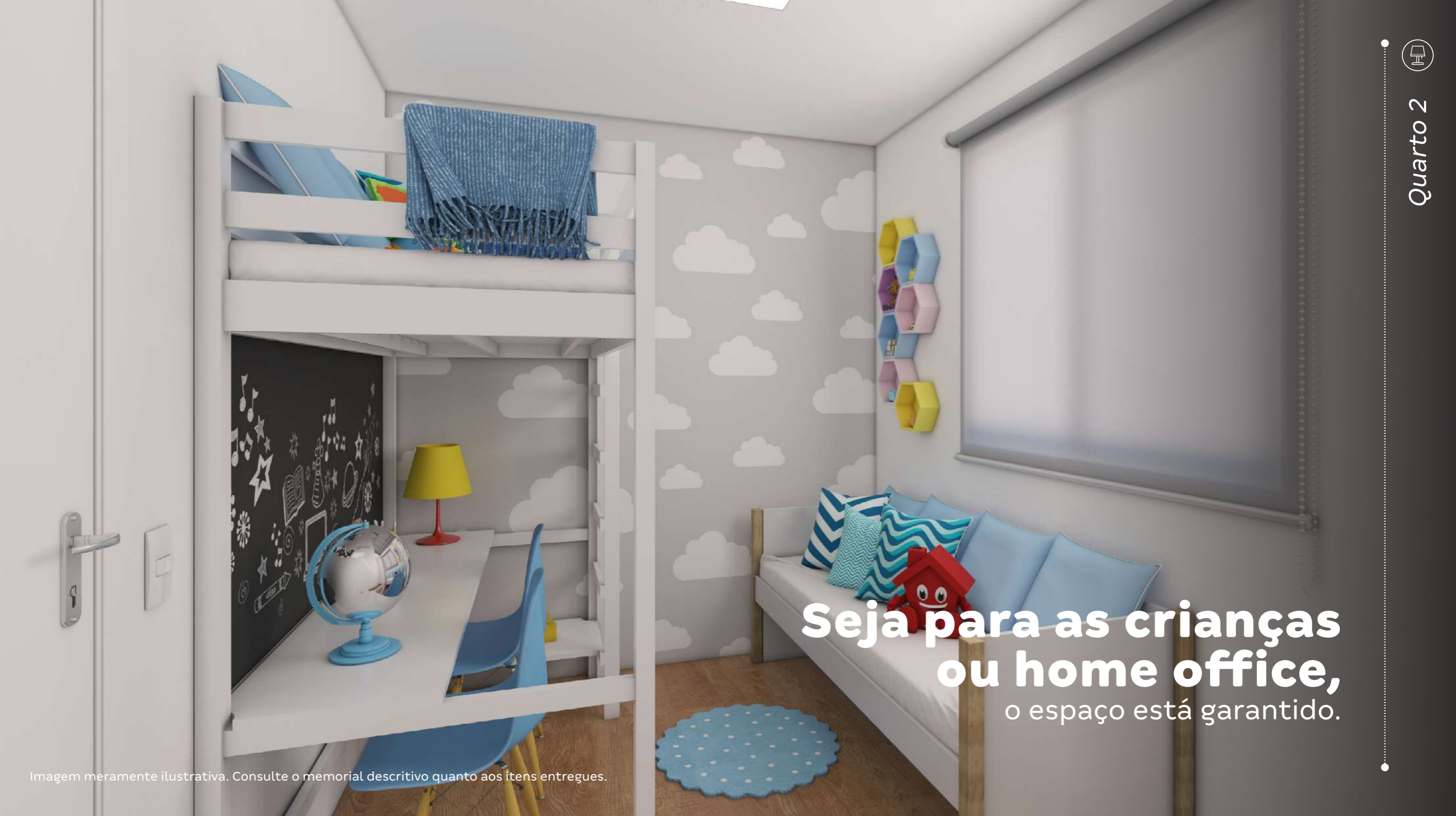
Imagem meramente ilustrativa. Consulte o memorial descritivo quanto aos itens entregues.

Seja para as crianças ou home office, o espaço está garantido.