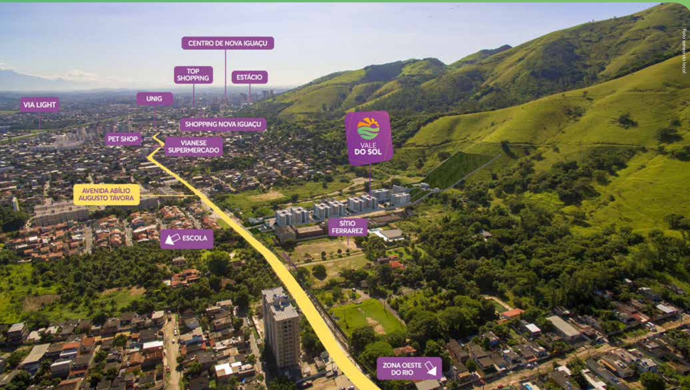
Foto aérea do local

TEMPOS ESTIMADOS EM PERCURSO POR AUTOMÓVEL."