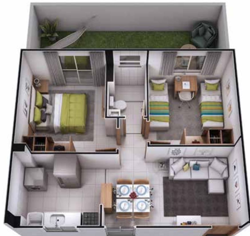
UNIDADE 102 - BLOCO 01

Em cada espaço, um detalhe pensado em você.