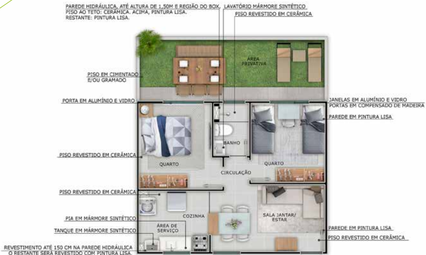
UNIDADE 102 - BLOCO 01