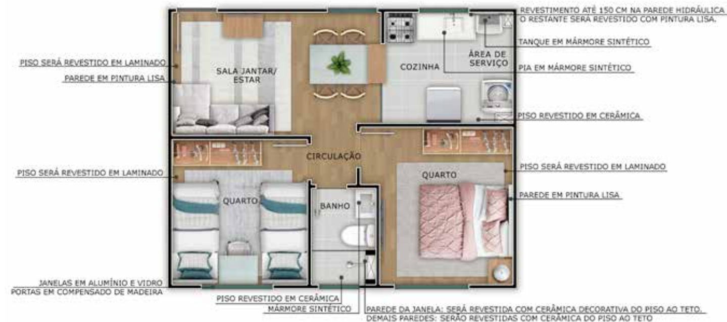
UNIDADE 203 - BLOCO 01