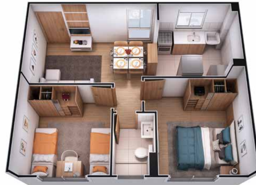
UNIDADE 203 - BLOCO 01

A decoração é mera sugestão, esta planta poderá sofrer variações decorrentes do atendimento das posturas municipais, das concessionárias e do local. As cotas são medidas de eixo a eixo das paredes. Não fazem parte do apartamento o acabamento dos pisos e bancadas, podendo ser adquiridos pelo Exclusivista.