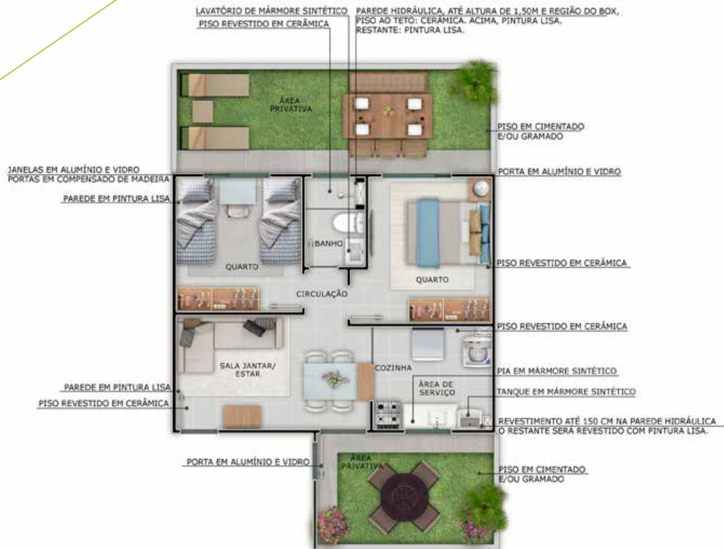
UNIDADE 101 - BLOCO 01