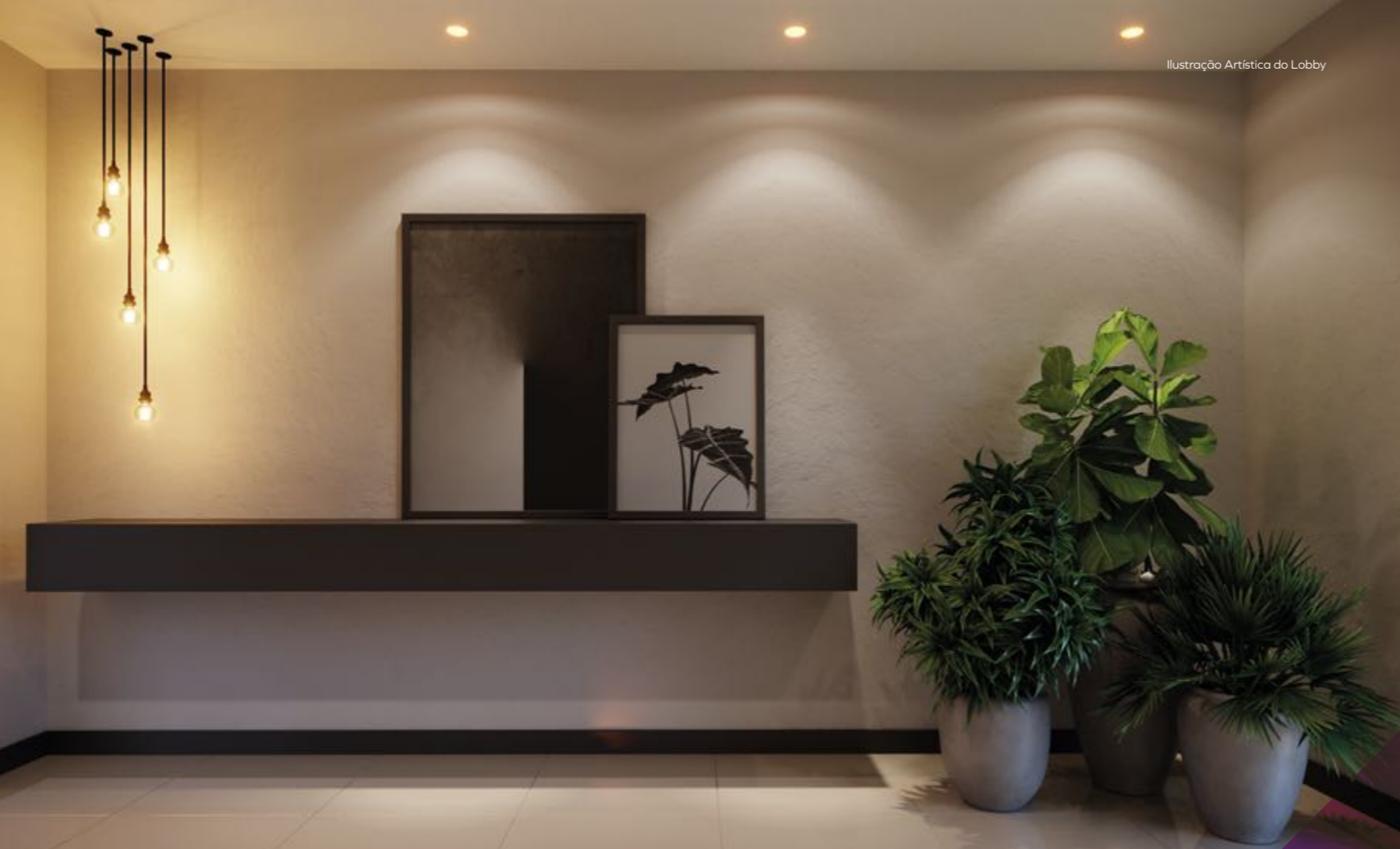
Ilustração Artística do Lobby