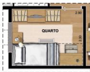
SUGESTÃO DE LAYOUT COM BELICHE