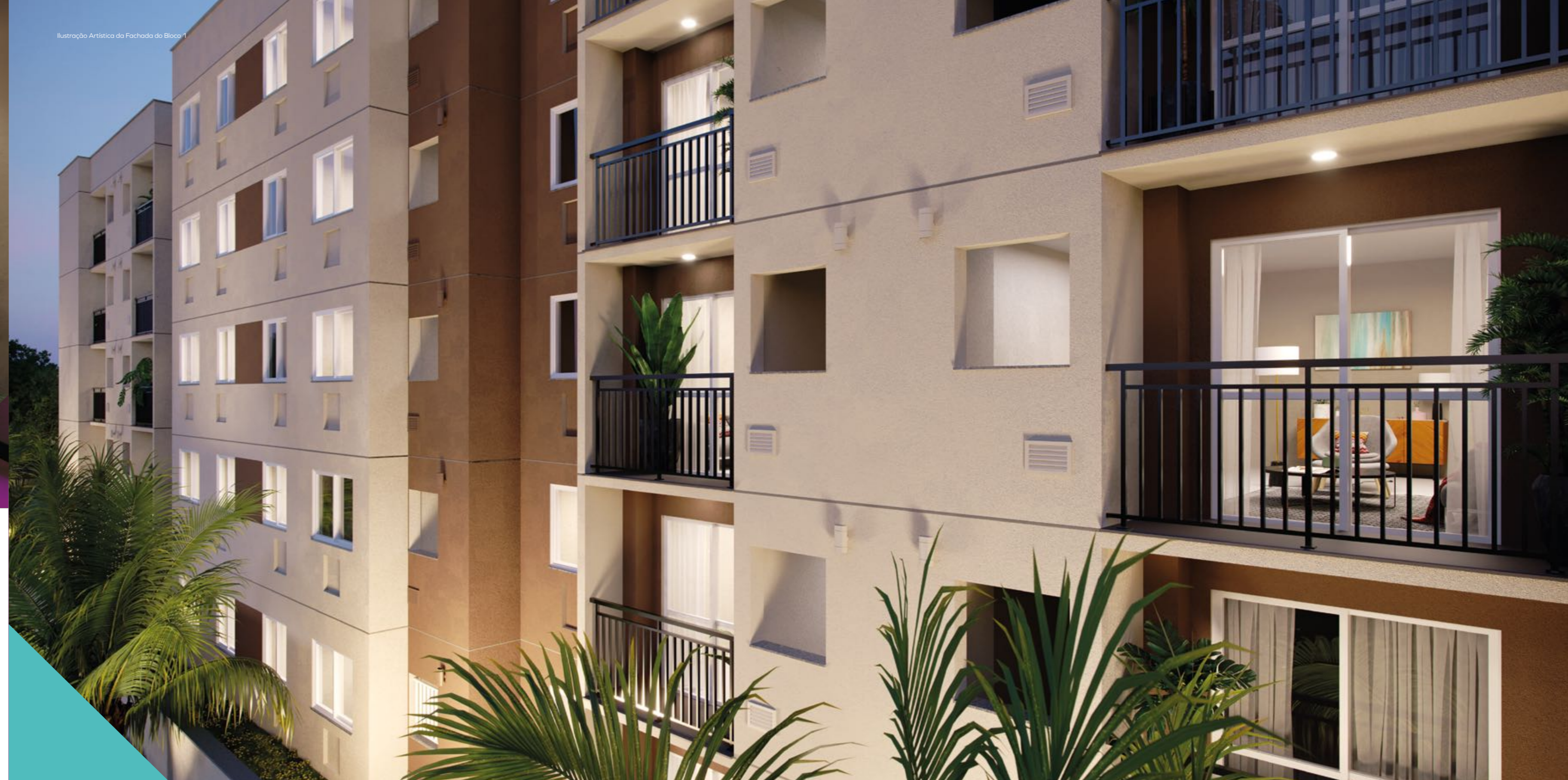
Ilustração Artística da Fachada do Bloco 1