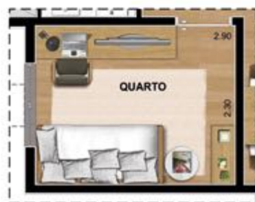
SUGESTÃO DE LAYOUT HOME OFFICE