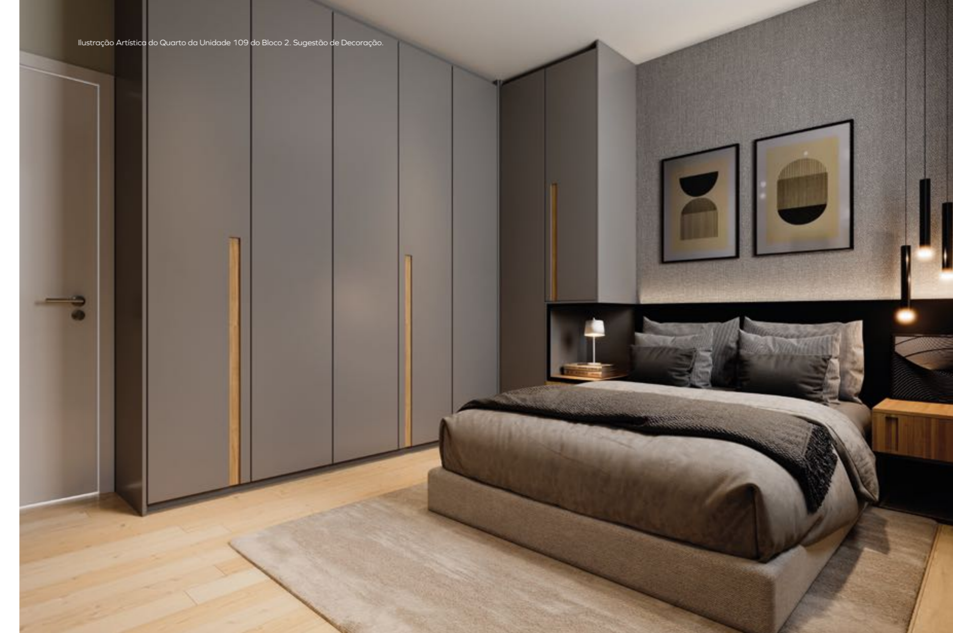
Ilustração Artística do Quarto da Unidade 109 do Bloco 2. Sugestão de Decoração.

Um lugar só seu, aconchegante e tranquilo. O refúgio ideal para recarregar as energias.